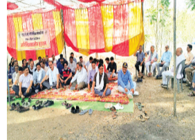
पढ़ाई प्रभावित हो रही है। लेकिन अब तक प्रबंधन और शासन की ओर से

विदिशा। चिलचिलाती धूप के बीच एसएटीआई के कर्मचारी पिछले 13 दिनों से धरने पर बैठे हैं। कर्मचारियों का आरोप है कि उन्हें पिछले 7 माह से वेतन नहीं मिला है, जिससे आर्थिक संकट गहरता जा रहा है। इस हड़ताल के कारण कॉलेज का सामान्य कामकाज ठप हो गया है और लगभग 850 विद्यार्थियों की